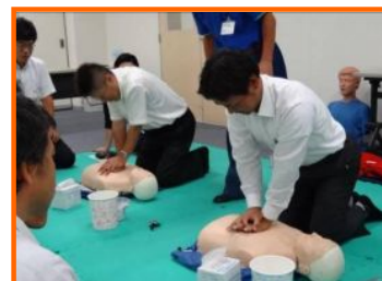
《写真5》普通救命講習