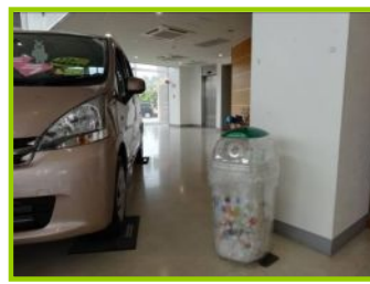
《写真2》エコキャップ回収BOX