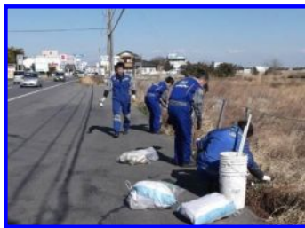
《写真1》拠点周辺ゴミ拾い活動