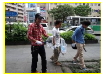
《写真3》清掃ボランティア