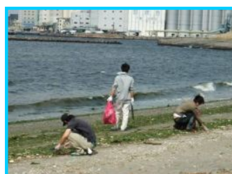
【写真2】海岸清掃ボランティア活動に参加