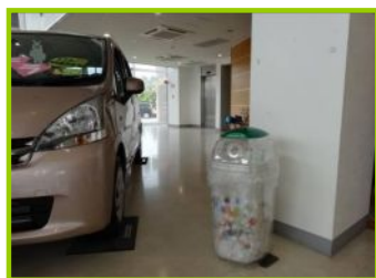
【写真1】ショールームに回収BOXを設置